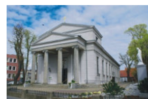
Kościół pw. św. Stanisława Biskupa i Męczennika w Buku