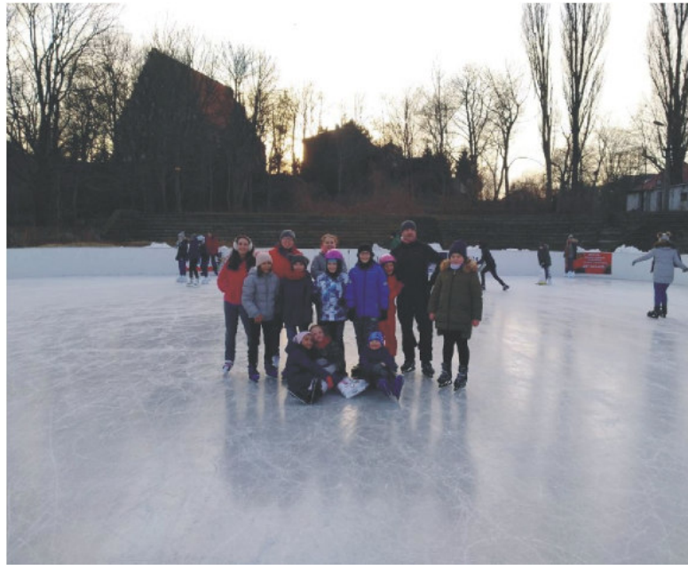
Dziecięca schola na lodowisku Bogdanka